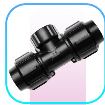
سه راه ماده