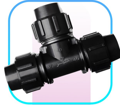
سه راه ساده