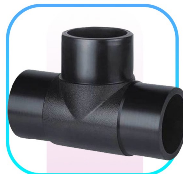
سه راه جوشی