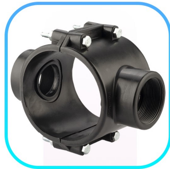
کمر بند دو طرفه